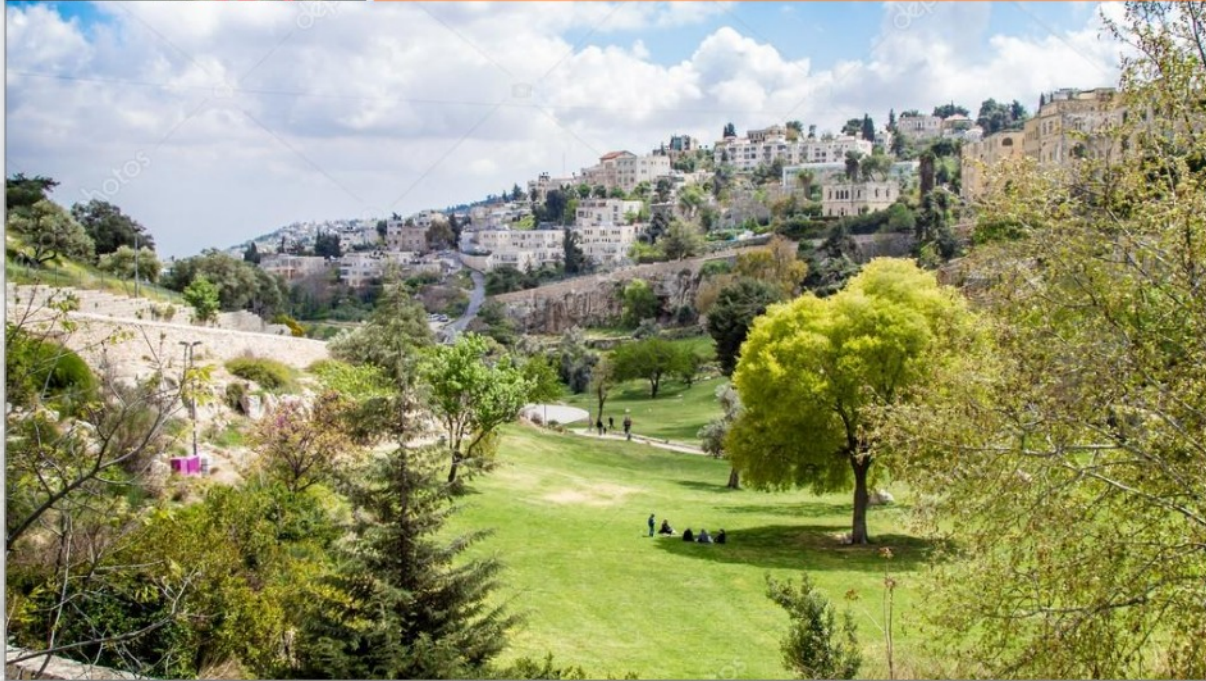
El ahora del Valle de Hinom

Vamos a Apocalipsis para ver qué nos dice: